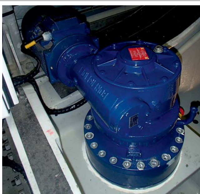
neues Drehgetriebe einer Vestas V90 Im Hintergrund der Drehmotor