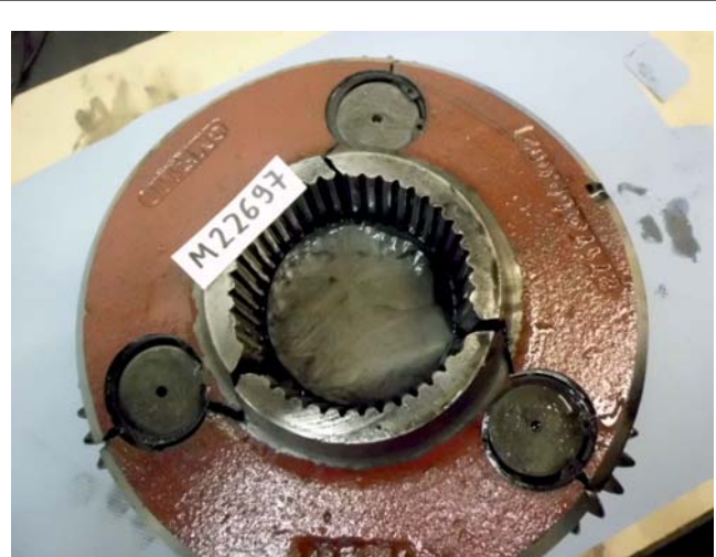
gebrochener Planetenträger aus einem Drehgetriebe (V90).

Das von der Reservice Betriebsführung angewandte Testverfahren für Drehgetriebe beruht auf Temperaturmessungen. Es kann durch qualifiziertes Personal bei einer Anlagebegehung durchgeführt werden. WEAn in der technischen Betriebsführung von Reservice werden auf Wunsch bei der turnusmäßigen Begehung überprüft. Die Dauer der Begehung verlängert sich dadurch nur unwesentlich. Werden bei dem Test Auffälligkeiten festgestellt, wird die entsprechende WEA danach von dem zuständigen Serviceunternehmen angefahren und der Schaden mit den herkömmlichen Verfahren festgestellt.